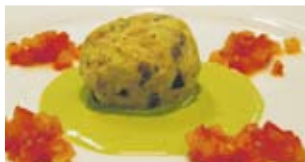
Auberginen und Büffelkäse auf Basilikumsauce