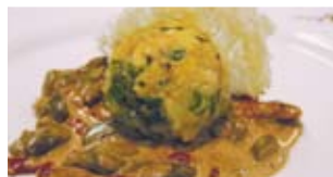
Grüner Spargel mit getrockneten Tomaten