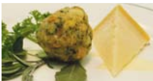
Gemüse mit Salzeibutter und Parmesan