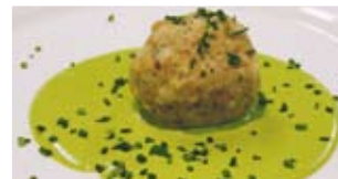
Buchweizen mit Schnittlauch