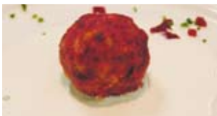
Rote Bete mit Gorgonzola