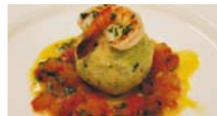
Krevetten und Tomatenconcasser